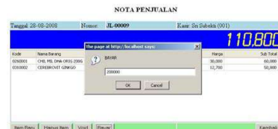
Gambar 4. Tampilan Pembayaran

Pembayaran dilakukan dengan menekan tombol bayar, sehingga akan memunculkan kotak pengisian jumlah pembayaran (gambar 4), dan kemudian Sistem juga akan otomatis menghitung jumlah kembalian disesuaikan dengan besarnya pembayaran.