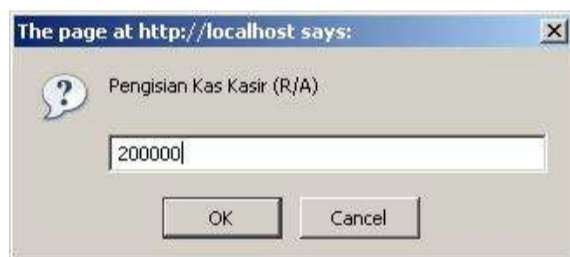
Gambar 1. Pengisian Kas Kasir

Pengisian modal untuk kasir, misalnya pada saat awal toko buka, dapat dilakukan dengan memilih menu Receive Account (R/A) . Pemilihan menu ini akan memunculkan tampilan permintaan pengisian modal untuk kasir seperti yang ditunjukkan gambar 1.