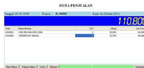
Gambar 3. Tampilan Nota Penjualan

diisi. Pengisian dilakukan dengan mengetikkan kode barang di kolom pertama, apabila kode barang tidak ditemukan maka akan muncul pesan "kode barang tidak ada", tetapi jika kode barang tersebut ada maka pada baris tersebut akan dilengkapi dengan nama barang dan harga secara otomatis. Selanjutnya kasir tinggal mengisi jumlah penjualan, apabila jumlah penjualan sudah diisi maka sistem akan otomatis menghitung subtotal dari item penjualan tersebut dan sekaligus akan menampilkan nilai total faktur ke dalam tampilan display dengan ukuran font besar sehingga dapat dilihat oleh customer.