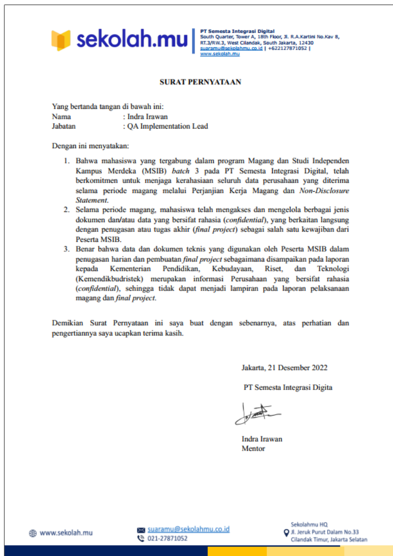
Gambar 14. Dokumen Teknik

Dokumen tersebut berbunyi seperti pada pernyataan di bawah ini :