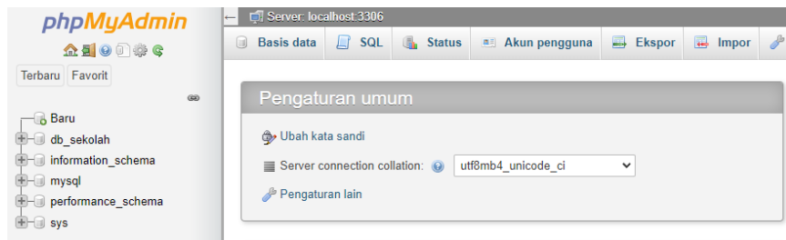
Gambar 4. 2 tampilan database PHPMysql