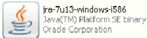
Gambar 1. JRE 7u13

Untuk membuka file Jar saja tanpa mengedit source code, cukup install "JRE7u13" yang ada di folder "Software Pendukung". Lihat gambar 1!