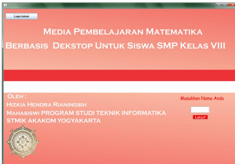
Gambar 4. Halaman utama dari Skripsi.jar

Menampilkan halaman utama apabila software pendukung sudah terinstall dengan baik. Lihat gambar 4!