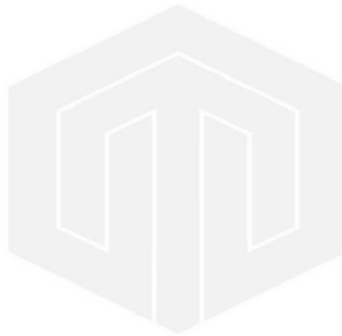
Gambar 2.2 Review dan Revisi Manuskrip