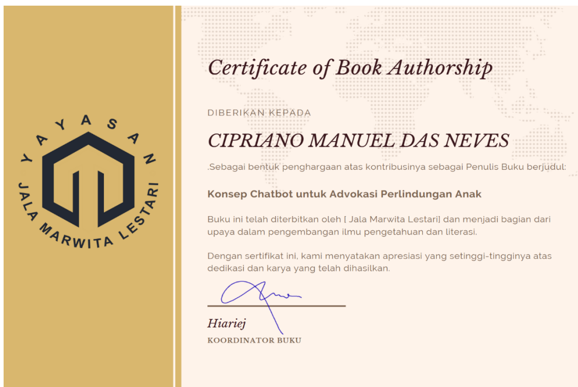
Gambar 2.5. Sertifikat Penulis

Sertifikat Penulis dari penerbit atau konfirmasi resmi bahwa draft buku telah melalui tahap Review Secara keseluruhan, Sertifikat Penulis atau konfirmasi resmi ini memberikan kepastian kepada penulis bahwa draft buku telah diterima dan akan diterbitkan, menunggu proses mendapatkan ISBN dan HKI.