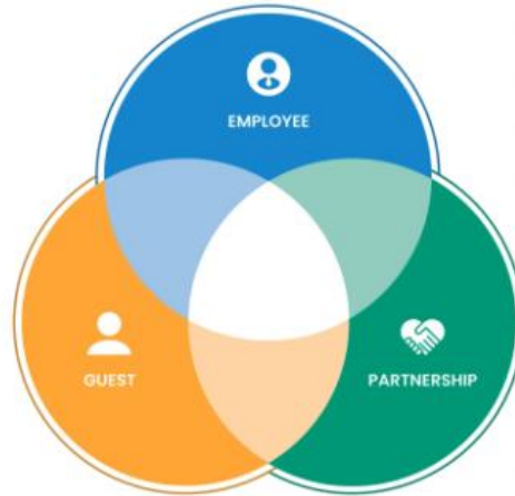
Gambar 2. 2 Organization Squad

Pada Gambar 2.2, menunjukkan bagaimana Employee , Guest , dan Partnership berkolaborasi dalam tim lintas fungsi untuk mencapai tujuan bersama.