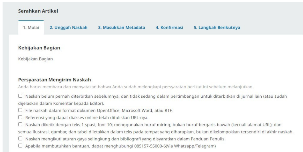
Gambar 2. Proses Upload Artikel