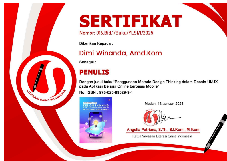
Gambar 3.3 Sertifikat penulis

Gambar 3.3 adalah Sertifikat Penulis yang diberikan sebagai bentuk pengakuan atas kontribusi dalam proses penyusunan dan penerbitan buku ini. Sertifikat ini memuat nama penulis, judul buku, serta nomor sertifikat yang menjadi bukti resmi keterlibatan penulis dalam penerbitan karya ini.