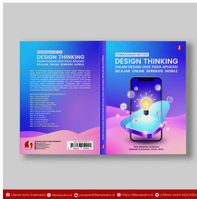
Gambar 3.1 Cover Buku

Gambar 3.1 merupakan Cover buku yang menjadi simbol penting dalam menunjukkan karakteristik buku serta memberikan informasi kepada calon pembaca tentang isi dan tujuan buku. Visual yang ditampilkan pada cover buku dirancang dengan pendekatan estetika yang sesuai untuk menarik perhatian pembaca, terutama yang berminat pada bidang desain UI/UX dan metode Design Thinking.